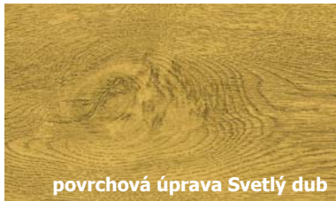
povrchová úprava Svetlý dub

A práve takéto brány sú kvalitnejšie. Najširší sortiment sekcionálnych brán, ich dizajnových a technických prevedení, ponúka spoločnosť Hörmann. Brány zn. Hörmann sú na najvyššom vývojovom stupni a v celoeurópskom meradle má spoločnosť Hörmann pozíciu číslo 1 medzi výrobcami brán. Navyše u spoločnosti Hörmann kúpite aj protipožiarne dvere, ktoré sú povinnou súčasťou každého nového domu s garážou či kotolňou, vnútorné ako aj domové dvere v niekoľkých typových a cenových úrovniach. Z jednej ruky tak môžete mať brány, pohony aj dvere.