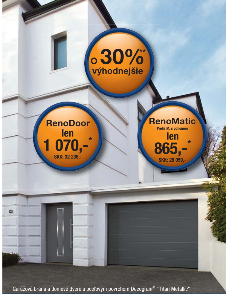
Garážová brána a domové dvere s ocelovým povrchom Decograin® "Titan Metallic"

V neposlednom rade sa vždy ale bude jednať o cenu. Tejto skutočnosti sú si vedomí aj u spoločnosti Hörmann a od 1.2.2009 prichádzajú s akčnou ponukou „Brána a dvere roka“. Už za 865,- € si môžete kúpiť garážovú bránu typu EPU 40 v rozmere 2500 x 2125 mm, v troch farebných prevedeniach – biela, zlatý dub, titan metallic, a to vrátane pohonu ProMatic, montáže a DPH. Ďalej si v akčnej ponuke môžete zakúpiť domové dvere v zodpovedajúcom dizajne k akčnej garážovej bráne už za 1 070,- € vrátane montáže a DPH.